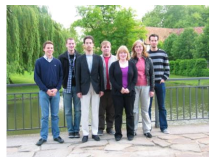
Der neu gewählte Vorstand der Jungen Union Steinfurt